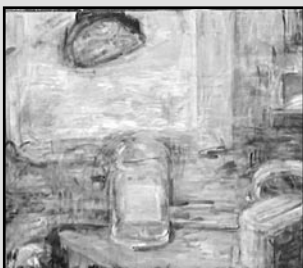
František Tržil – Zátiší