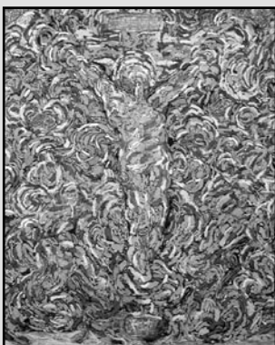
Tomáš Rossí – Ukřižování